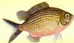
Castagnole ( Chromis chromis ) 12 cm*