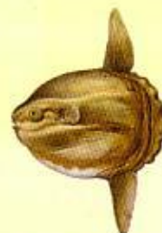
Poisson lune ( Mola mola )

Attention, certaines réglementations locales peuvent être différentes, se renseigner auprès des AFFAIRES MARITIMES du Quartier maritime concerné. * Tailles préconisées CNPPM. Cette planche est valable pour le littoral Méditerranéen. Lorsque deux tailles sont indiquées, il est nécessaire de se renseigner auprès des autorités locales.