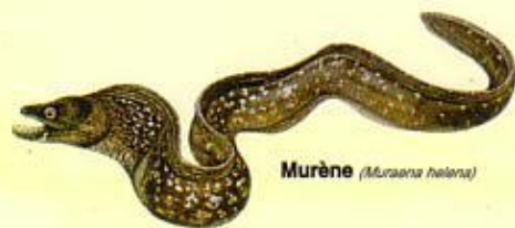
Murène ( Muraena helena )