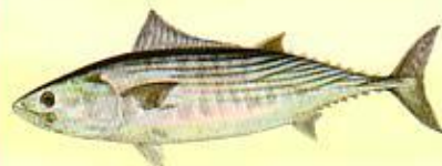
Bonite à dos rayé ( Sarda sarda )