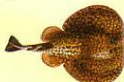
Raie torpille marbrée ( Torpedo marmorata ) 36 cm*