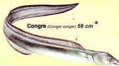
Congre ( Conger conger ) 58 cm*