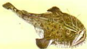
Baudrole (lotte) ( Lophius piscatorius ) 50 cm*