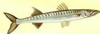
Brochet de mer-sphyrène ( Sphyræna sphyraena )