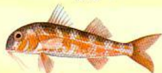
Rouget Barbet ( Mullus barbatus ) 11 cm

CONFÉDÉRATION NATIONALE DE LA PLAISANCE ET DE LA PÊCHE EN MER