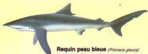
Requin peau bleue ( Prionace glauca )