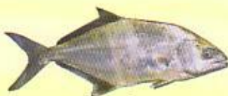
Liche amie ( Lichia amia )