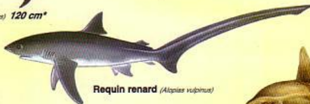
Requin renard ( Alopias vulpinus )