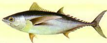
Thon blanc germon ( Thunnus alalunga ) 3 kg*