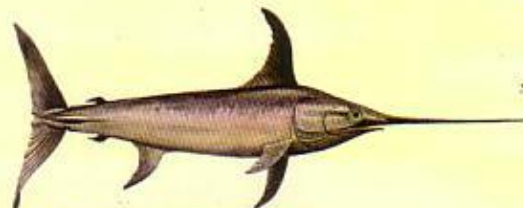
Espadon ( Xiphias gladius ) 120 cm*