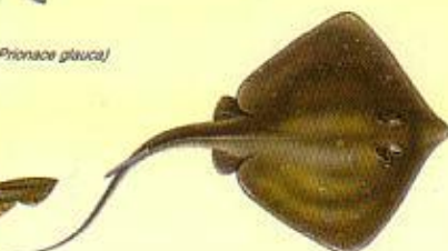
Raie pastenague ( Dasyatis pastinaca ) 36 cm*