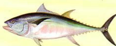
Thon rouge ( Thunnus thynnus ) 115 cm ou 30 kg