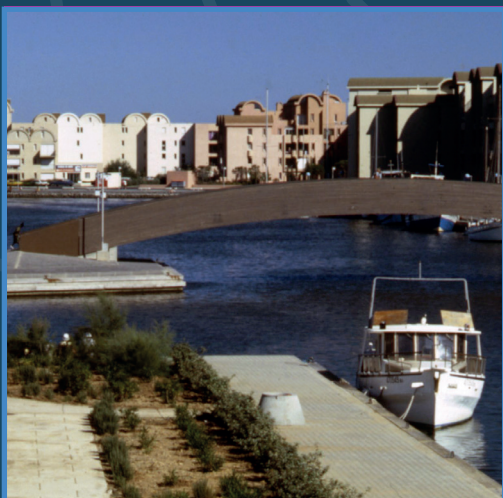
la passerelle piétonne