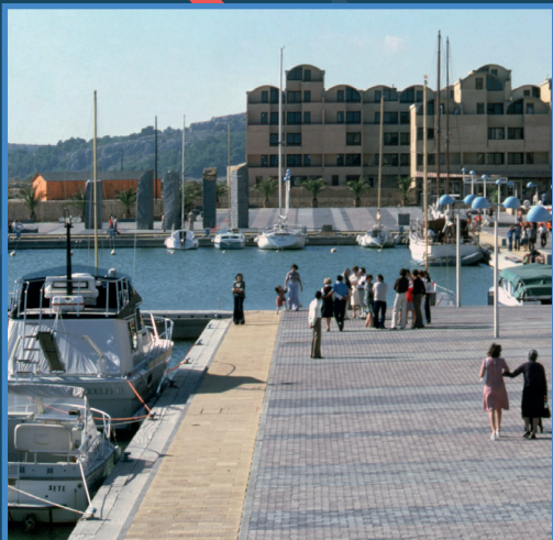
le bassin d'honneur