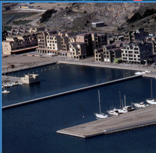
le bassin 1